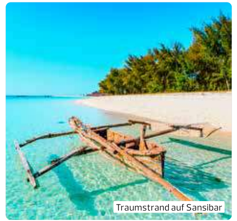
Traumstrand auf Sansibar