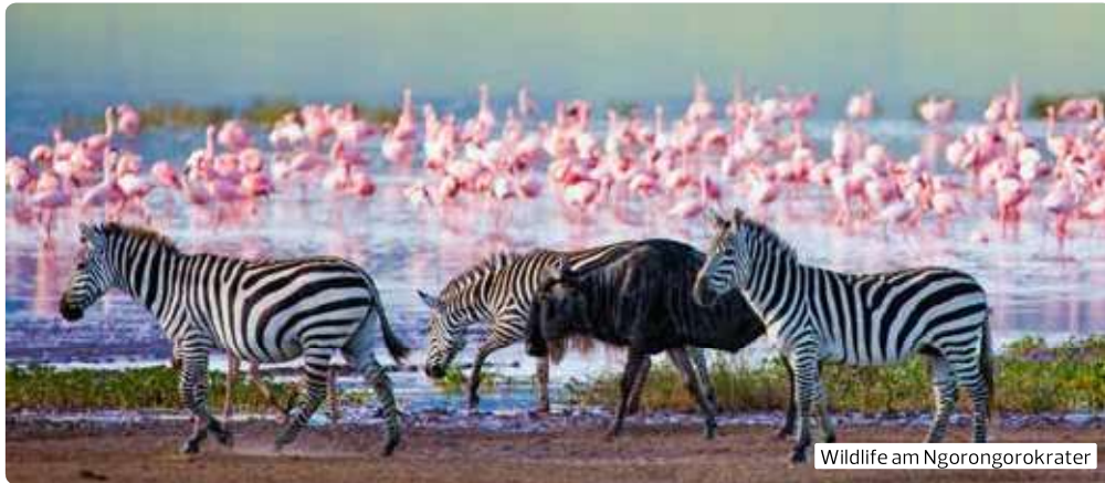
Wildlife am Ngorongorokrater