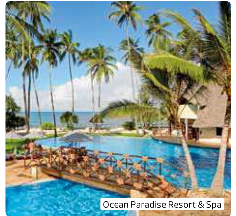
Ocean Paradise Resort & Spa

8. Tag: Ngorongoro-Krater – Höchste Tierdichte der Welt (UNESCO-Weltnaturerbe) (Mo) Fahrt in den Ngorongoro-Krater, der von Prof. Dr. Bernhard Grzimek als „8. Weltwunder“ bezeichnet wurde. Pirschfahrt im Ngorongoro-Krater mit Picknick Lunch. Der größte nicht überflutete Kraterkessel der Welt hat einen Durchmesser von 19 km und ist 600 m tief. Die üppigen Weidegründe und das stets vorhandene Grundwasser des Kraterbodens ernähren eine große Zahl von den Tieren; bis zu 25.000 Säugetiere halten sich gleichzeitig im Krater auf. Am späten Nachmittag fahren Sie nach Karatu. Eine Nacht in der Marera Valley Lodge (Landeskategorie: 3 Sterne), Ca. 160 km (F, M, A)